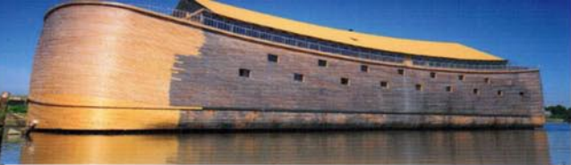
de ark van Noach