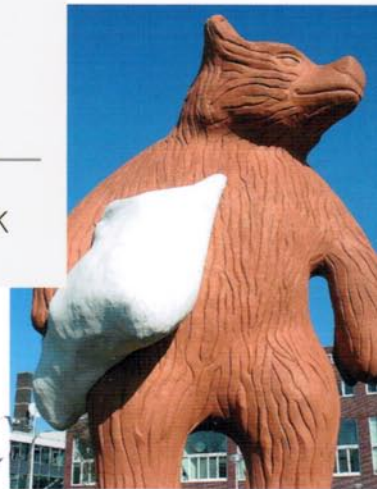
Stadman, de baksteen- knuffelbeer