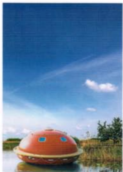
drijvende luxe suite

111 BIZARRE LOCATIES EN HUN BIJZONDERE VERHAAL